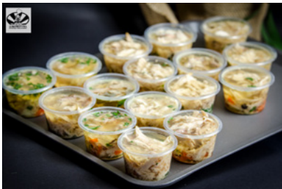
Galarekta z kurczaka z jajkiem przepiórczym