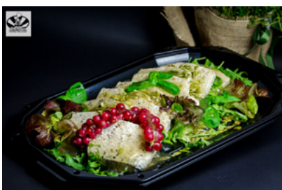
Terrina bazyliowa z kurczaka