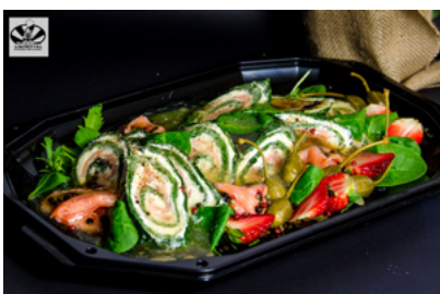
Rolada szpinakowa z wędzonym łososiem