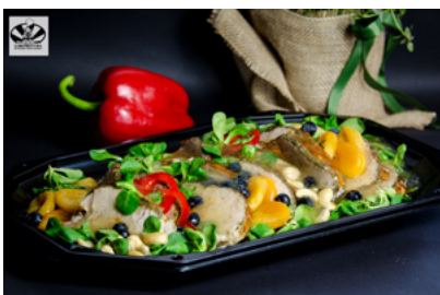
Schab pieczony z awokado i papryką