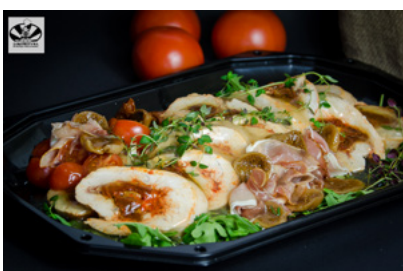
Pierś z indyka z pastą peperonata, szynką dojrzewającą i suszonym pomidorem