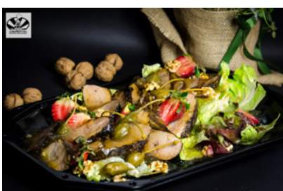
Połędwiczka wieprzowa marynowana w jałowcu z konfiturą z czerwonej cebuli