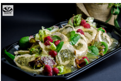
Pierś z indyka, z serem mascarpone i pastą szpinakową