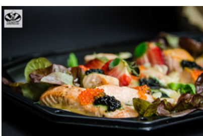
Łosoś pieczony z kawiolem pod galaretą z białego wina